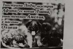
Самодостаточная кошечка, 1,5 года, не шкандит, не царапает мебель, бесплатная стерилизация через месяц. Томасушка Леди, шустрих Афина, ее копил Пина, ушастенькая Амелия, в масочке Оливия

Очаровательные девчонки. Игривые, здоровенькие, обожают играть с собаками и людьми. Будут средними по размеру, послушными собаками и отличными друзьями.